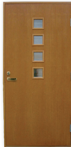
Teno U-arvo 0,83