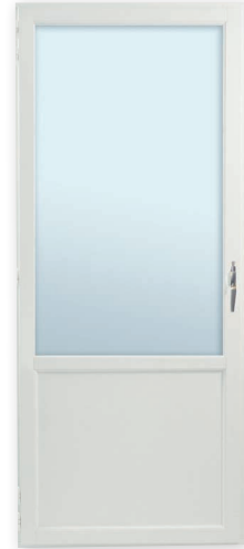
Turner PO-ALU U-arvot kuten PO-M