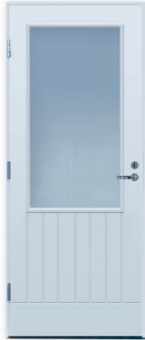
Turner PO-M14 U-arvo 0,86