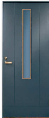
Kitka U-arvo 0,82