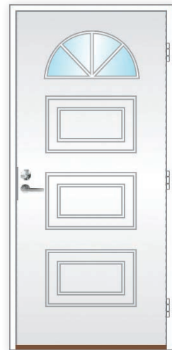
Suvanto U-arvo 0,80