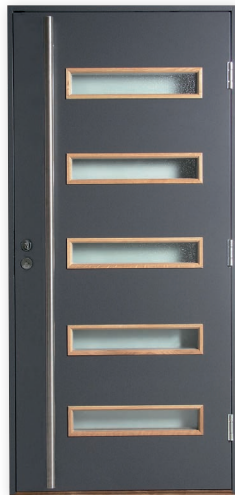
Saimaa 5L U-arvo 0,95