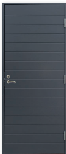
Turner V810 U-arvo 0,80