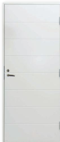
Turner V820 U-arvo 0,80