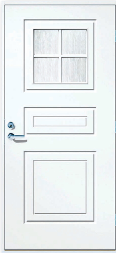
Keitele U-arvo 0,82