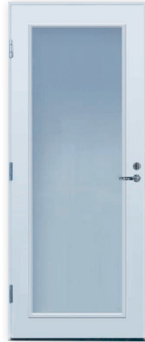
Turner PO-KL U-arvo 0,98