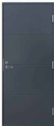
Turner V800 U-arvo 0,80

Autotallinoven tyyliin sopivat varastonovet!