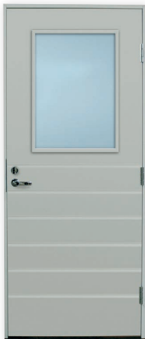
Puula U-arvo 0,78