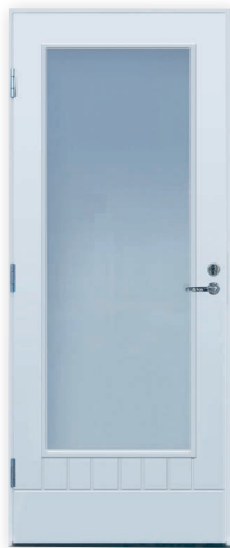
Turner PO-M18 U-arvo 0,94