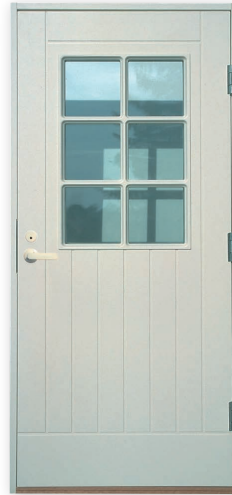
Pielinen U-arvo 0,82