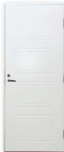
Turner V840 U-arvo 0,80