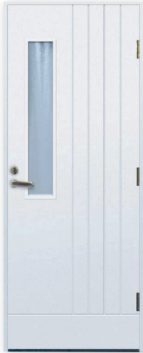
Inari U-arvo 0,80

Turner ulko-ovet ovat energiatehokkuudeltaan maailman kärkeä ja täyttävät kaikki viranomaismääräykset. Voit valita ulko-oveesi myös edullisen Turner-värisävyn kolmesta vaihtoehdosta: RAL 7024, RAL 8017 ja RAL 9016.