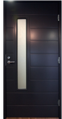
Päijänne U-arvo 0,85