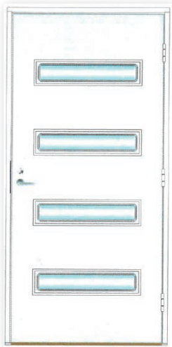
Saimaa 4L U-arvo 0,95