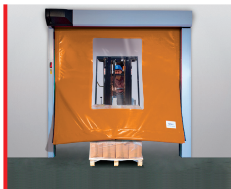
Itsestään takaisin asettava