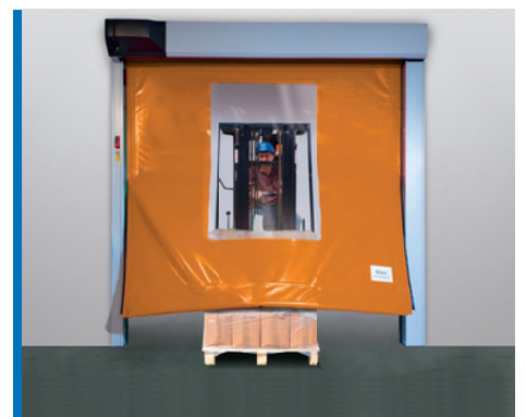
Itsestään takaisin asettava

Tilaa säästävä ratkaisu - Sector Resetin kompakti rakenne ja moottorin sijainti mahdollistavat asennuksen kapeisiin käytäviin tai muihin ahtaisiin tiloihin. Itsekantava runko tuo lisää joustavuutta, jos seinämateriaali, johon ovi kiinnitetään, ei ole varmuudella tiedossa.