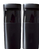
Fotocell för säkerhet

Förhindrar att porten stängs om det finns ett hinder vid portens bana.