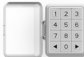
KODLÅS T01 2-KAN

Underlättar användningen av porten då fjärrkontrollerna inte finns lättillgängliga. Trådlös kodlås kan placeras på ytterväggen i garaget.