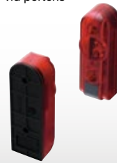
FOTOCELL FÖR SÄKERHET

Förhindrar att porten stängs om det finns ett hinder vid portens bana.